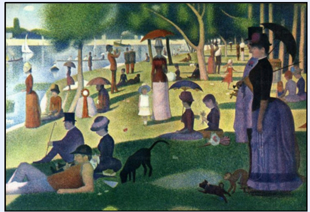
Un après-midi sur l'île de la Grande Jatte, Georges-Pierre Seurat

La chaleur de notre jeunesse n'attend pas, Courrons ensemble, l'automne est là.